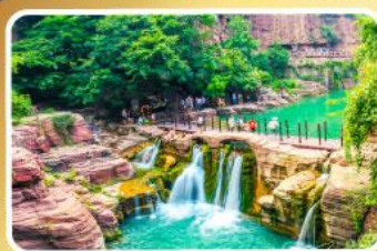
อุทยานหยุ่นโกซาน