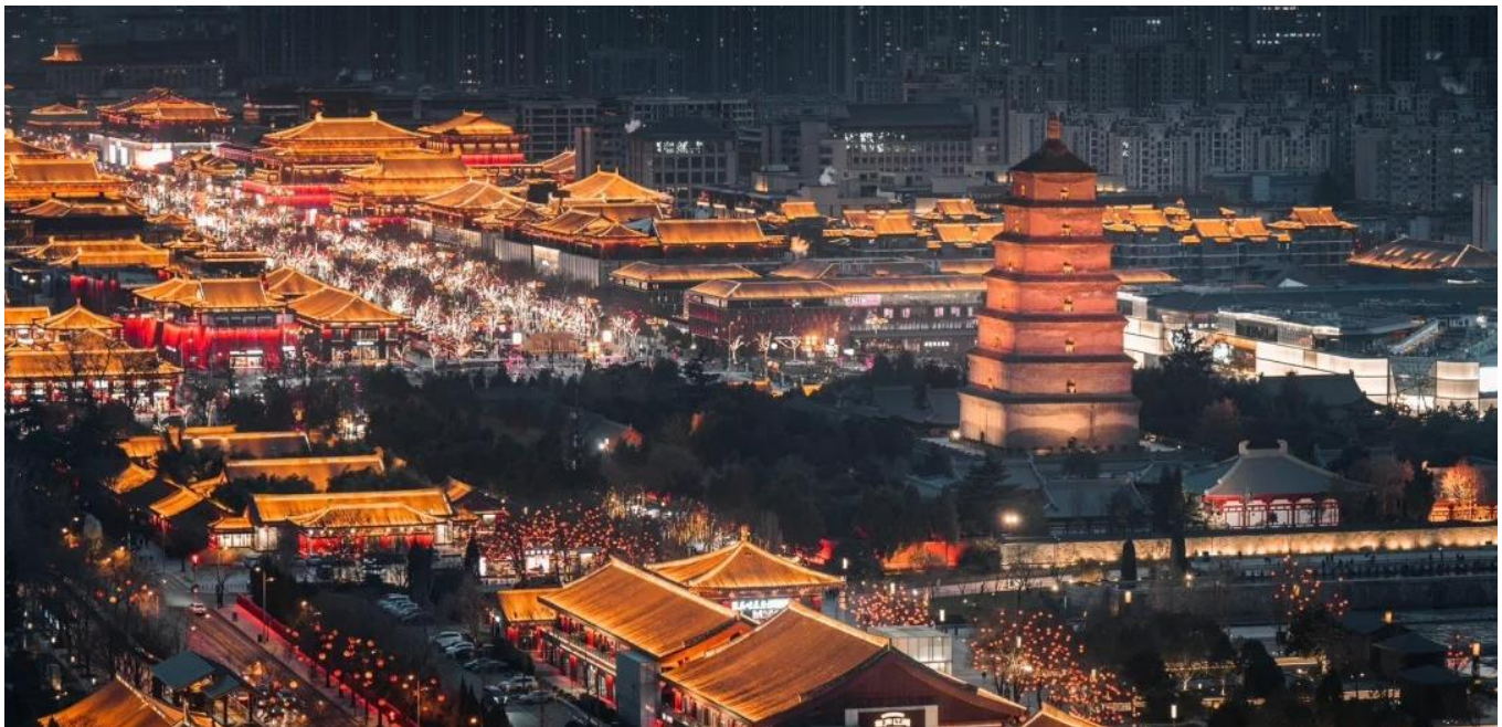
ค่ำ รับประทานอาหารค่ำ ณ ภัตตาคาร (มื้อที่ 12)

सानซี ตั้งอยู่ในหุบเขาที่มีแม่น้ำเว่ยไหลผ่าน มีประวัติศาสตร์ยาวนานกว่า 3,000 ปี ได้ถูกสถาปนาเป็นราชธานีในนาม “นครฉางอาน” เคยเป็นนครหลวงในสมัยต่างๆ รวมทั้งสิ้น 13 ราชวงศ์ ซื่ออันได้เป็นศูนย์กลางการติดต่อทางเศรษฐกิจและวัฒนธรรมระหว่างจีนกับประเทศต่างๆ ทั่วโลก เป็นจุดเริ่มต้นของเส้นทางสายไหมอันเลื่องชื่อ มีโบราณสถานโบราณวัตถุเก่าแก่อันล้ำค่าและเป็นแหล่งท่องเที่ยวที่สำคัญของจีน นำท่านเข้าชม ถนนคนเดินต้าถิง แหล่งท่องเที่ยวสายไหม เสมือนถนนสายวัฒนธรรม ที่จะประดับสีเหลืองทองยามค่ำคืน ที่ซึ่งเหล่าวัยรุ่นจะมาสวมชุดฮั่นผู้กันเต็มทั้งพื้นที่ตลอดทั้งคืน นอกจากนี้ยังมีร้านค้าเครื่องประดับ ของกินของใช้ และกิจกรรมอีกมากมายให้ท่านได้สัมผัสกันอย่างเต็มอิ่ม