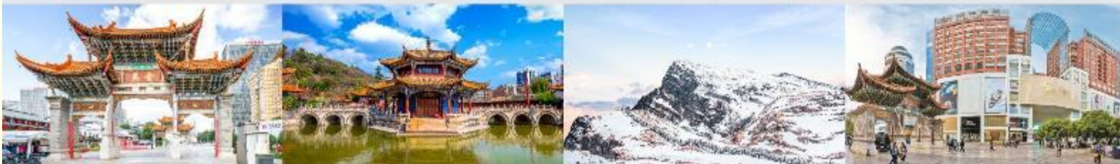
ประตูม้าทองโก่หยก