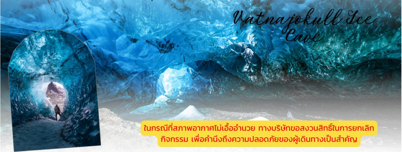
Vatnajokull Ice Cave

นำท่านเดินทางสู่ ถ้ำน้ำแข็งวักนาโจกุล (Vatnajokull Ice Cave) ระยะเวลาในการทำกิจกรรมประมาณ 4 ชั่วโมง เป็นหนึ่งในสถานที่ท่องเที่ยวที่น่าตื่นตาตื่นใจที่สุดในไอซ์แลนด์ ตั้งอยู่ภายในธารน้ำแข็งวักนาโจกุล ซึ่งเป็นธารน้ำแข็งที่ใหญ่ที่สุดในประเทศและมีขนาดใหญ่เป็นอันดับสองในยุโรป โดยมีพื้นที่มากกว่า 8,000 ตารางกิโลเมตร และถือเป็นพื้นที่ที่สำคัญในด้านภูมิศาสตร์และนิเวศวิทยา ถ้ำเหล่านี้ถูกสร้างขึ้นโดยการละลายและการเคลื่อนตัวของน้ำแข็งภายใต้ธารน้ำแข็ง ทำให้เกิดเป็นห้องโถงขนาดใหญ่ที่เต็มไปด้วยน้ำแข็งใสและสวยงาม มีสีฟ้าและขาวสะท้อนแสงในรูปแบบที่น่าทึ่ง นอกจากนี้ ภายในถ้ำยังมีรูปแบบที่หลากหลาย เช่น เสาหินน้ำแข็ง และร่องรอยจากการละลายที่สร้างลวดลายที่น่าสนใจ ซึ่งทำให้ทุกถ้ำมีลักษณะเฉพาะที่แตกต่างกันไป