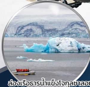
ล่องเรือธารน้ำแข็งโจกุลซาลอน