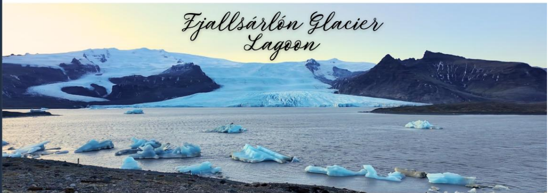
Fjallsárlón Glacier Lagoon

นำท่านเดินทางสู่ ธารน้ำแข็งพยาลล์ซาร์ลอน (Fjallsárlón Glacier Lagoon) เป็นทะเลสาบธารน้ำแข็งที่ตั้งอยู่ในเขตอุทยานแห่งชาติวักนาโจกุล (Vatnajökull National Park) ธารน้ำแข็งพยาลล์ซาร์ลอนเป็นสถานที่ที่เต็มไปด้วยความสวยงามของธรรมชาติ เจียบ สงบ และ เป็นทะเลสาบปิด ทำให้น้ำมีความนิ่งและก้อนน้ำแข็งในทะเลสาบมีลักษณะเฉพาะที่แตกต่าง