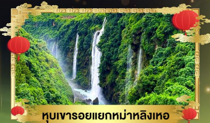
หุบเขารอยแยกทงมาหลิงเหอ