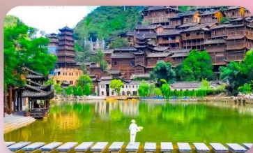
หมู่บ้านเฟิงหลินปู้