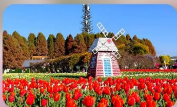
สวนดอกทิวลิป