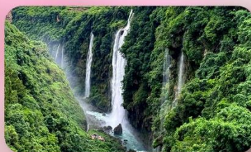
ภูเขาธารรอยแยกหม่าหลิงเหอ