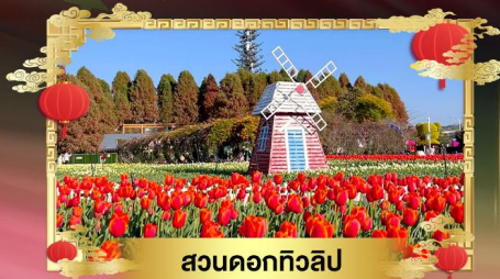
สวนดอกทิวลิป

"ชมเทศกาลดอกซากุระบานที่ดงเหมิง" เที่ยวหมู่บ้านไม้โบราณเฟิงหลินปู้