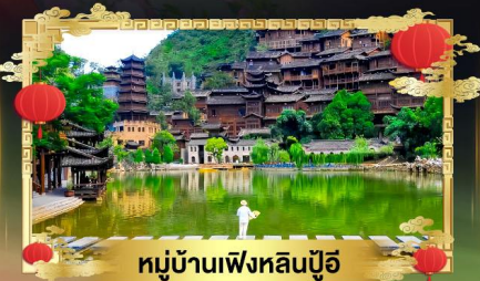
หมู่บ้านเฟิงหลินปู้