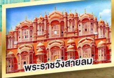
พระราชวังสายลม