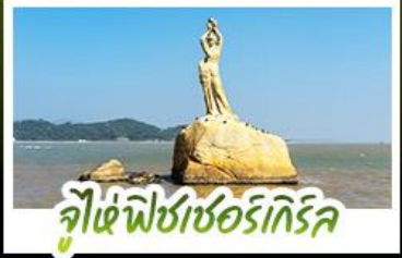
จูไห่พีชเชอร์เกิร์ล

เดิมค่าบรรยากาศสุดคลาสสิกสไตล์อังกฤษ ณ THE LONDONER MACAO ไหว้พระ-ตั้ง 3 วัดตั้ง ขอพรการทำงาน การเงิน ความรัก ครบจบในทริปเดียว ชมความวิจิตรตระการตาของพระราชวังหยวนหมิงหยวนใหม่แห่งจูไห่ ช้อปปิ้งจุใจ ย่านจิมซาจุ่ยและถนนคนเดินฟู้ทวอลล์