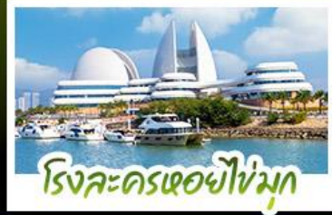
โรงละครเซียวไซ่มุก