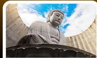
เนินเขาแห่งพระพุทธรเจ้า