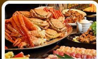
บุฟเฟ่ต์ชาบู+ชาปู 3 ชนิด