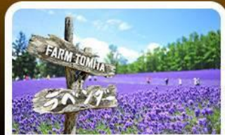
โทมิตะฟาร์ม