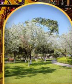
ชมดอกซากุระ ณ สวนจงยวง