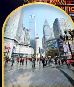
ถนนคนเดินเจียฟ้างเป็ย