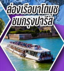
ล่องเรือบาโตมุซ ชมกรุงปารีส

เที่ยวเมืองวาอูซ เมืองหลวงของสาธารณรัฐ ลิกเทนสไตน์