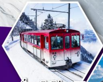
นั่งรถไฟใต้เขาริกกี