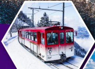
นั่งรถไฟใต้เขาริกิ