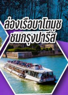
ล่องเรือบาโตมุช ชมกรุงปารีส

เที่ยวเมืองวาอุซ เมืองหลวงของสาธารณรัฐ ลิกเทนสไตน์