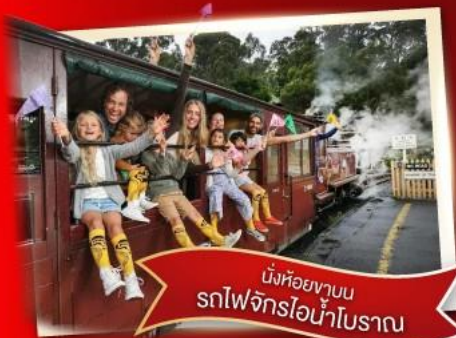
นั่งห้อยขาบน รถไฟจักรไอน้ำโบราณ