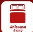
พักรูม 4 اتاق