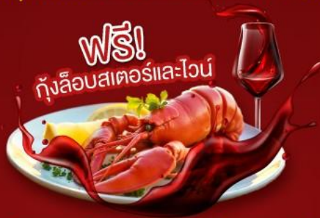
ฟรี! กุ้งล็อบสเตอร์และไวน์