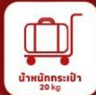
น้ำหนักกระเป๋า 20 kg