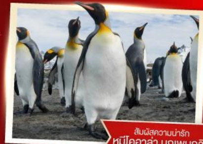
สัมผัสความน่ารัก หมีโคอาล่า นกเพนกวิน