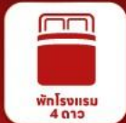
พักรูมแรม 4 اتاق