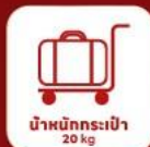
น้ำหนักกระเป๋า 20 kg