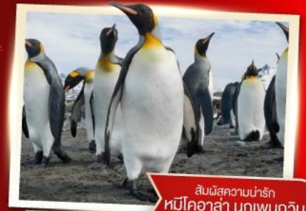
สัมผัสความน่ารัก หมีโคอาล่า นกเพนกวิน