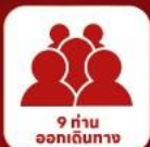
9 ท่าน ออกเดินทาง