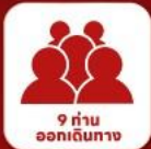
9 ท่าน ออกเดินทาง