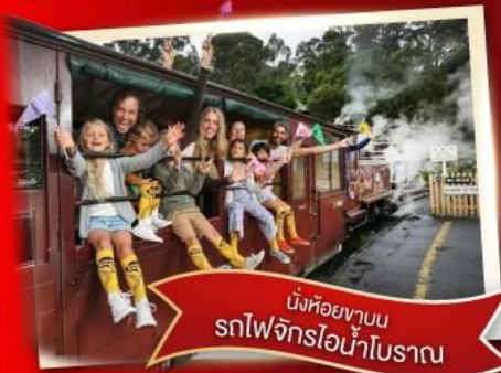
นั่งห้อยขาบน รถไฟจักรไอน้ำโบราณ