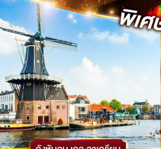
กังหันลม เดอ อาครियิน