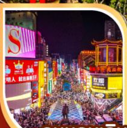
ถนนคนเดิน หวงซิงลู่