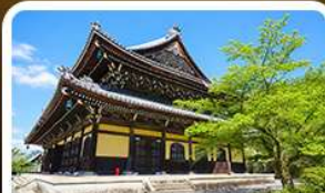
วัดนันเซ็นจิ