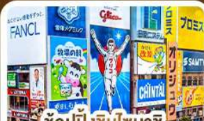
ช้อปปิ้งชินโซบาชิ และโดตงโบริ