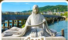
เมืองอิจิ สวรรค์คนรักชาเขียว