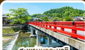
สะพานนากะบาชิ ทาคายาม่า