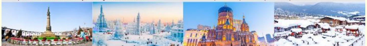
อนุสาวรีย์ฟิ่งหง