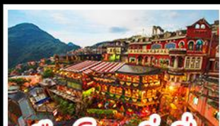
เมืองโบราณจิวเฟิ่น