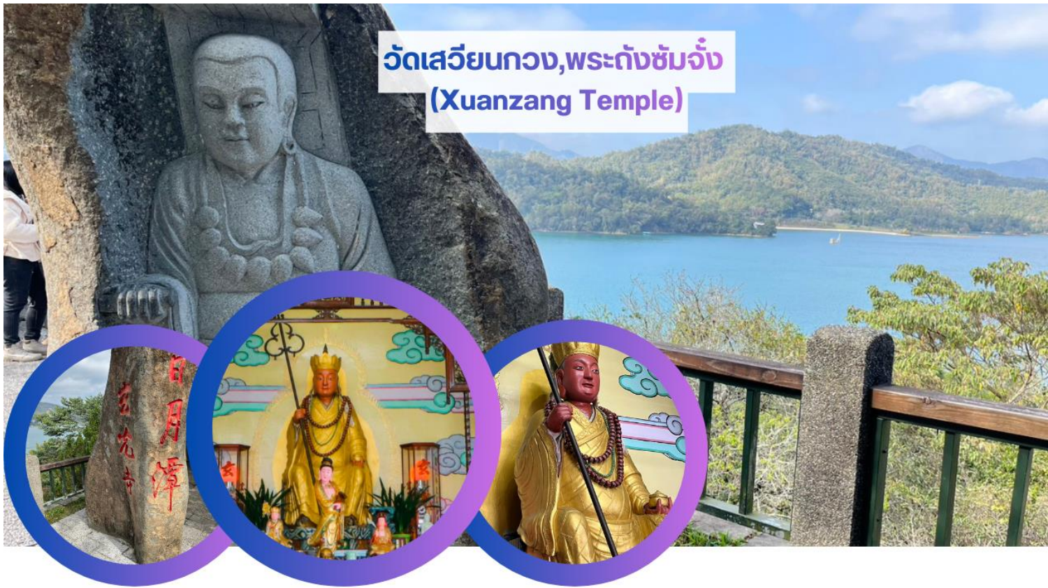
วัดเสวียนกวง, พระถังซำจั๋ง (Xuanzang Temple)