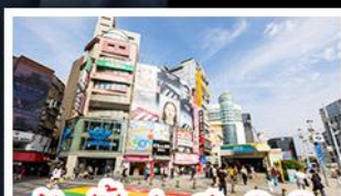
ช้อปปิ้งย่านซีเหมินติง