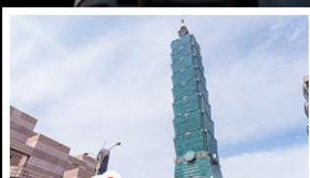
ตึก TAIPE 101