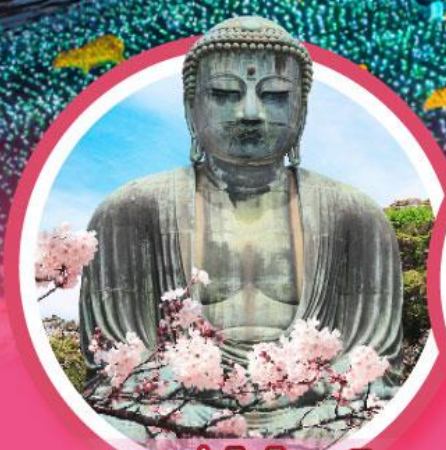
หลวงพ่อดโตโดบุตสึ