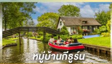
หมู่บ้านทีรูร์น