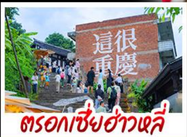
ตรอกเซี่ยฮ่าวหลี่