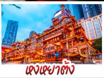
ตงเฉยตัง