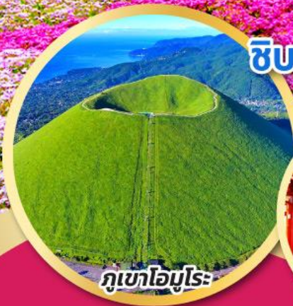
ภูเขาโอโมโระ

เทศกาลฟูจิ ชิบะซากุระ เฟสทีวัล (PINKMOSS)