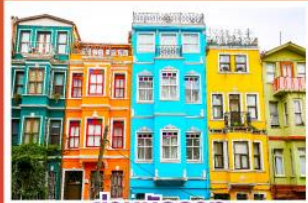
ย่านบิลลาท