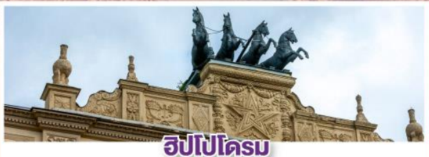
ฮิปโปโดรม