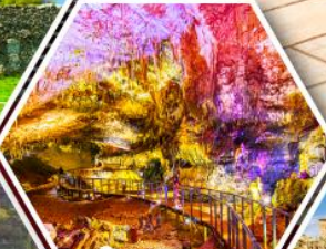
ถ้าไพรบิลูส