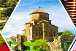
วิหารวงวารี