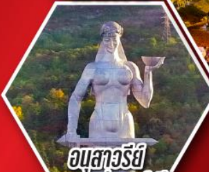
อมสวารีย์