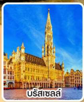
บริสเซลส์