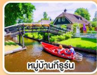
หมู่บ้านทีร์ูร์น