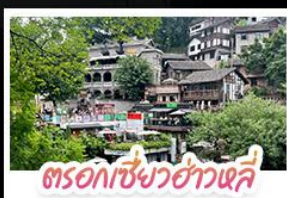
ตรอกเซียวฮ่าวเคี