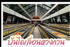
บันไดเลื่อนหวงกวน