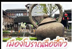
เมืองโบราณฉือชิว