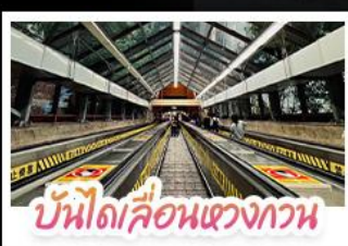
บันไดเลื่อนแขวงกาน