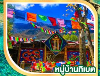
หมู่บ้านทิเบต