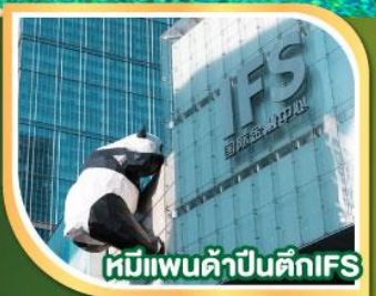
หมีแพนด้าปิ่นตึกIFS

20-24 ต.ค.67 16-20 พ.ย.67 30 พ.ย.-04 ธ.ค.67