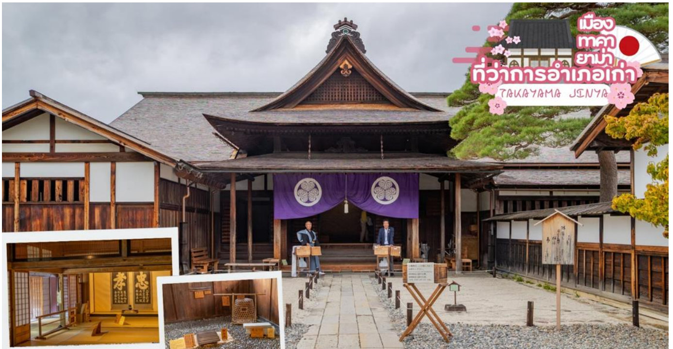
เมืองทาคายามา ที่ว่าการอำเภอเก่า TAKAYAMA JENYA

ผ่านชม ทาคายามา จินยะ หรือ ที่ว่าการอำเภอเก่าเมืองทาคายามา (ไม่รวมค่าเข้าชม) ซึ่งเป็นจวนผู้ว่าแห่งเมืองทาคายามา เป็นที่ทำงานและที่อยู่อาศัยของผู้ว่าราชการจังหวัดฮิเดะ เป็นเวลากว่า 176 ปี ภายใต้การปกครองของโชกุนตระกูลกุกาวา ในสมัยเอโดะ ตัวอาคารเป็นทั้งสถานที่ราชการ ห้องรับแขก ห้องประชุม รวมถึงห้องสอบสวนอีกด้วย