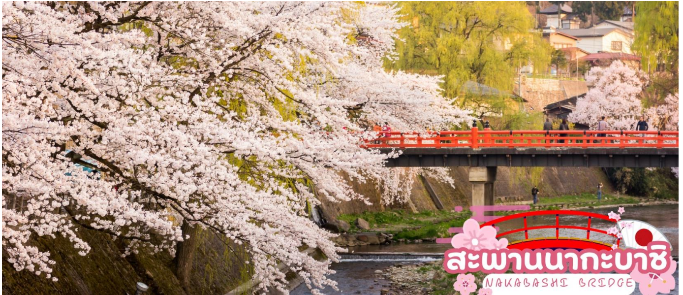
สะพานนากะบะชิ NAKABASHI BRIDGE

ผ่านชม ทาคายามา จินยะ หรือ ที่ว่าการอำเภอเก่าเมืองทาคายามา (ไม่รวมค่าเข้าชม) ซึ่งเป็นจวนผู้ว่าแห่งเมืองทาคายามา เป็นที่ทำงานและที่อยู่อาศัยของผู้ว่าราชการจังหวัดฮิเดะ เป็นเวลากว่า 176 ปี ภายใต้การปกครองของโชกุนตระกูลกุกาวา ในสมัยเอโดะ ตัวอาคารเป็นทั้งสถานที่ราชการ ห้องรับแขก ห้องประชุม รวมถึงห้องสอบสวนอีกด้วย