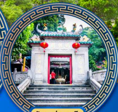
วัดอาม่า มาเก๊า