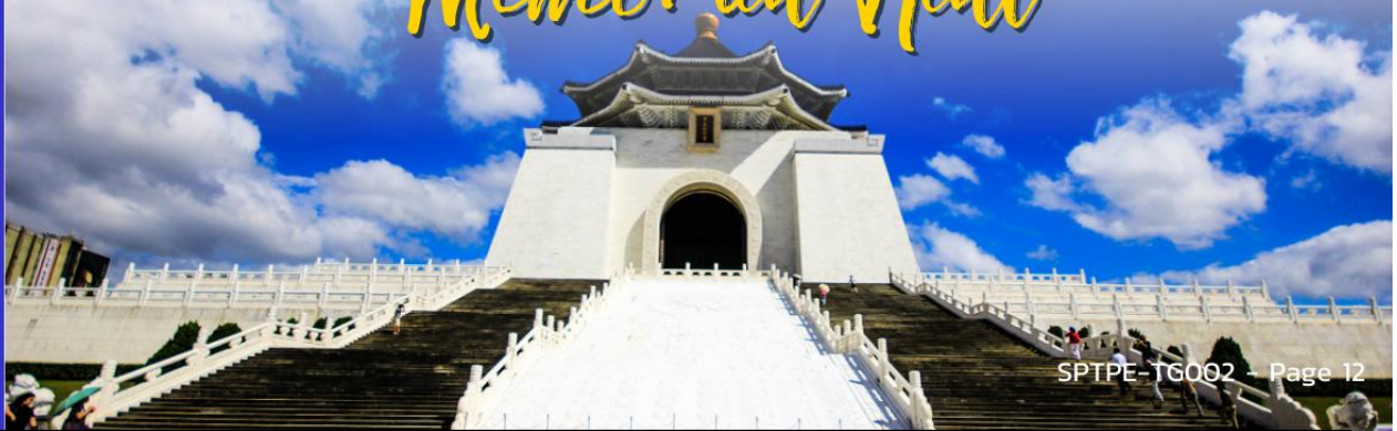
National Chiang Kai-Shek Memorial Hall

นำท่านเดินทางสู่ อนุสรณ์สถานเจียงไคเชก ตั้งอยู่ตรงใจกลางของเมืองไทเปที่มีพื้นที่ 2,500 ตารางกิโลเมตรแห่งนี้ถูกตกแต่งและประดับเป็นอย่างดี โดยตัวอาคารของอนุสรณ์สถานถูกสร้างขึ้นตามแบบสถาปัตยกรรมจีนโบราณ บันไดทั้งสี่ด้านถูกสร้างด้วยหินอ่อนสีขาวเป็นขั้นตามแบบพระมิดอียิปต์ หลังคาสีน้ำเงิน รวมทั้งยังมีสวนดอกไม้สีแดง ที่เป็นการแสดงออกทางสัญลักษณ์ให้เห็นถึงอิสรภาพ ความเท่าเทียม และความเป็นหนึ่งเดียวกัน ตามสีของธงชาติไต้หวัน สถานที่แห่งนี้นอกจากจะเป็นแลนด์มาร์คอันสำคัญของไทเปที่มีนักท่องเที่ยวมาเยี่ยมชมอย่างไม่ขาดสายแล้ว ยังเป็นโรงละครแห่งชาติและสถานที่สำหรับจัดคอนเสิร์ตของไต้หวันที่มีการแสดงจากศิลปินและนักร้องชื่อดังมากมายให้ผู้สนใจได้เข้าร่วมตลอดทั้งปี