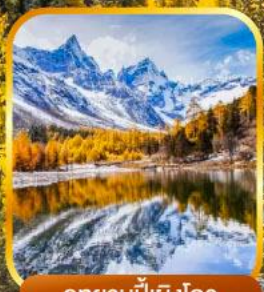
อุทยานπίงโกว