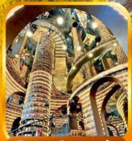
ร้านหนังสือจงซูเก้อ