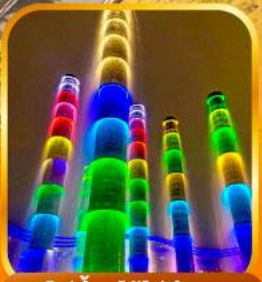
ชมไฟน้ำพุไม้ไฟตึก SKP