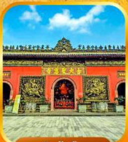
วัดต้าอ้อ