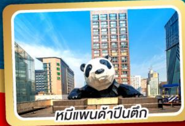
หมีแพนด้าปิ่นตึก