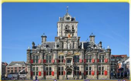
อาคารเมืองเก่าคลองเมืองเคลฟท์