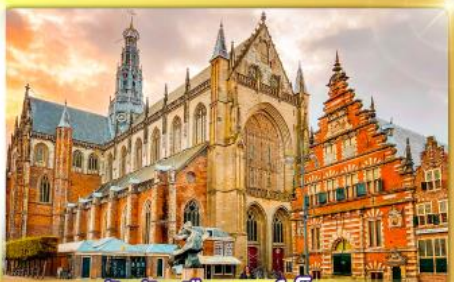
จัตุรัสเมืองฮาร์เล็ม

พรมแดนเมืองแปลกเนเธอร์แลนด์และเบลเยียม เติมน้องเคลฟท์ เมืองเครื่องปั้นดินเผาระดับโลก ฮาร์เล็มเมืองมั่งคั่งที่สุดของเนเธอร์แลนด์