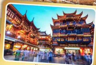
ตลาดร้อยปีฉินหวงเหมียว