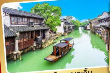
เมืองโบราณอูเจิ้น