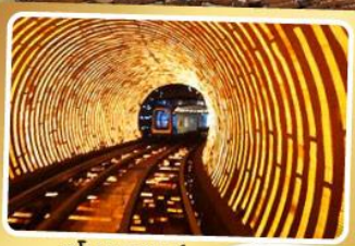
อุโมงค์เลเซอร์